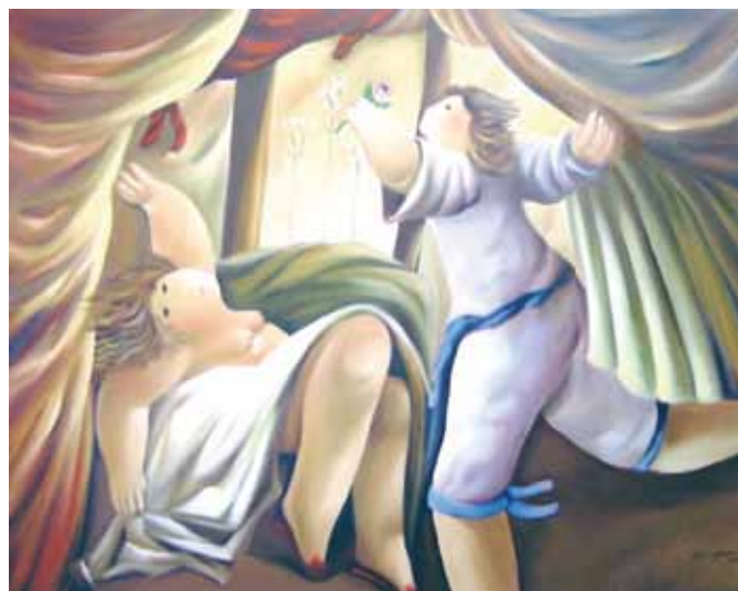
Serigrafia “Gesto de Amor”, 41 x 52 - Albino Moura 2010

A Direcção da Sociedade Portuguesa de Andrologia editou uma serigrafia original de Albino Moura numerada de 1 a 100 (executada nas Oficinas de Serigrafia Artística António Moreira) que será colocada à venda no Congresso com preços especiais para sócios.