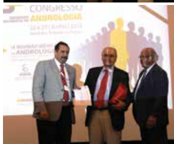
Prémio Dr. Sousa Sampaio/Mérito em Andrologia 2012.