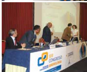
Prémios do Congresso da SPA.